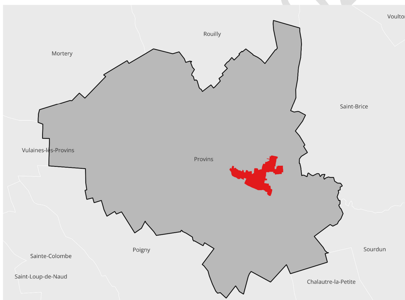
Figure 1 -Le périmètre du projet OPAH-RU à l'échelle communale - Villes Vivantes

Les élus et partenaires ont ainsi souhaité concentrer les moyens et engagements du futur dispositif opérationnel OPAH-RU comme réponse aux besoins spécifiques du cœur de ville de Provins, tout en s'inscrivant dans un projet stratégique territorial d'ensemble.